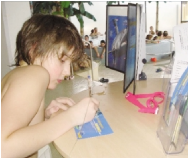
■ Mit Wissen gewinnen: Ein Rätselspiel lockt mit Preisen; Foto: Alexander Kock, Lüneburg

Durch eine Kombination aus innovativem, selbsterklärenden Unterwasser-Rätselparcours und weiteren, durch das Badpersonal angeleiteten, thematisch ausgerichteten Spielaktio-