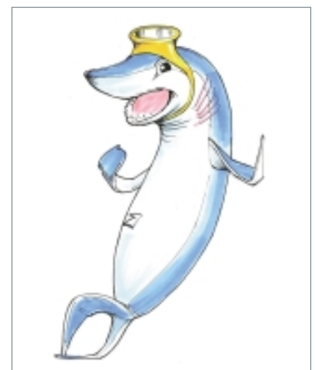
■ Abbildung 3: Logo des Hai-Moduls (Planet Ozean); Illustration: Ulrich Bachmann, Lüneburg

Bislang stärker auf Freizeitgäste, aber auch auf Schulklassen bezogen ist unser Produkt „Planet Ozean“. Dieses ebenfalls speziell für Erlebnisbäder entwickelte Edutainment-Produkt bietet dem Gast auf packende Art und Weise Wissenswertes rund um verschiedene Lebewesen der Ozeane. Ein erstes Erlebnispaket zum Thema Haie (siehe Abbildung 3) wurde bereits erfolgreich in der Lüneburger Salztherme (SaLü) getestet. In Kooperation mit Greenpeace Deutschland wird aktuell an einem weiteren Erlebnispaket gearbeitet, diesmal zum Thema Wale.