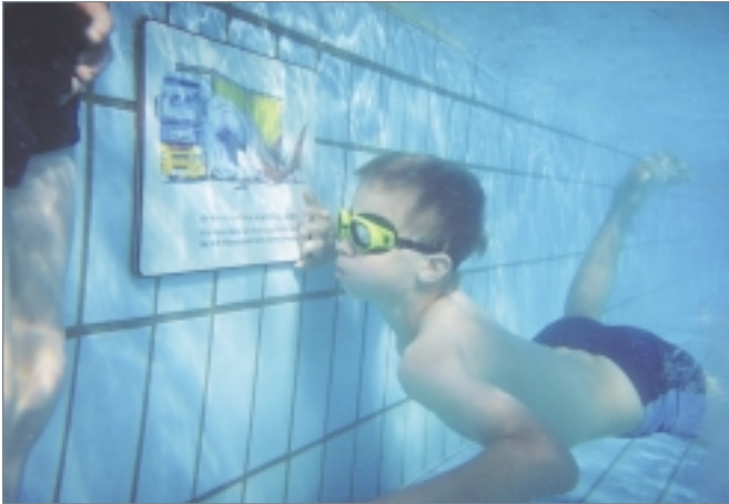
■ Lernen unter Wasser: eine der Stationen des Rätselparcours